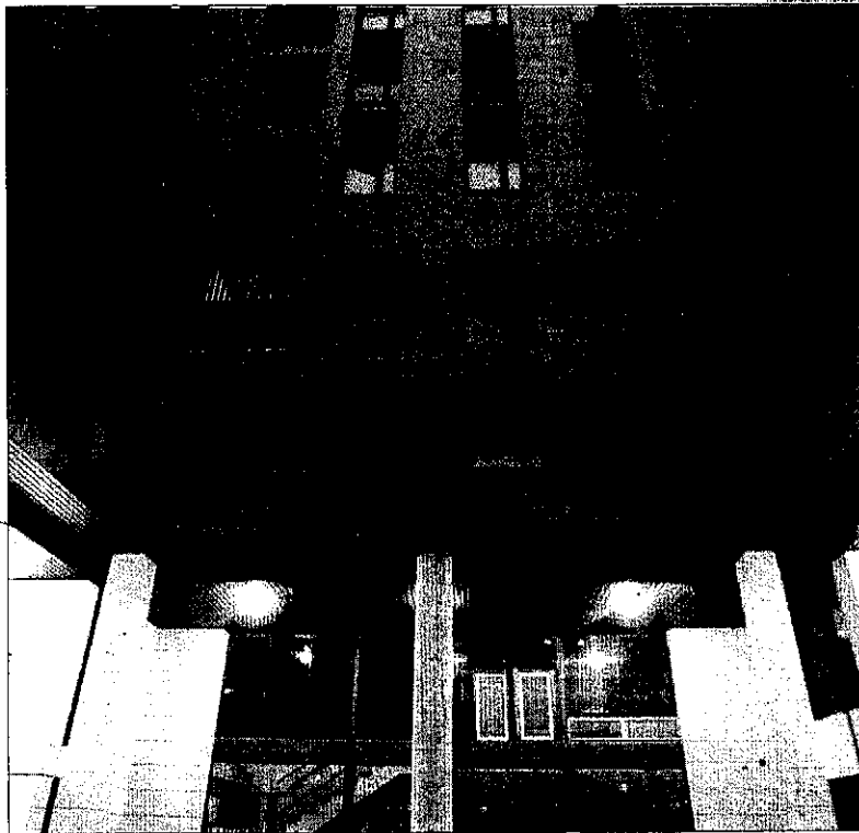
Imatge presa ahir de l'edifici des del qual es va precipitar el menor.

Per la seua part, la policia autonòmica ha obert una investigació per aclarir els fets. Tot apunta que la caiguda es va produir de forma accidental i es desconeix si els familiars del menor eren en aquell moment al domicili.