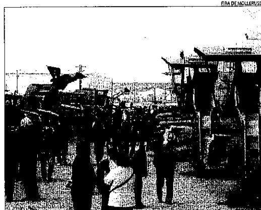
Autotrac compta amb un espai dedicat a la maquinària agrícola.

El director de Fira Mollerussa, Pere Gatnau, va reconèixer ahir que les vendes de vehicles i maquinària d'ocasió ha caigut respecte a l'any passat, encara que va descartar concretar xifres a l'espera del recompte definitiu. Gatnau va atribuir aquest descens a la "conjuntura econòmica", per la qual cosa va assegurar que "ha sigut una bona fira". "Els expositors es mostren satis-