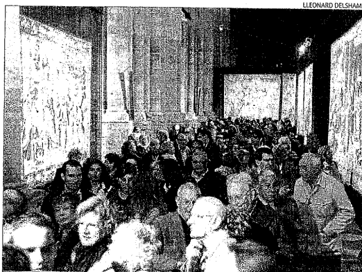
Inauguració de l'exposició de tapissos el maig passat.

D'altra banda, el consorci del Turó de la Seu Vella demanarà al capítol catedralici la cessió d'alguns dels tapissos flamencs que es poden veure a la nau central del monument a l'exposició que es clausurarà el mes que ve. "El Museu de Lleida exhibeix un tapís en la seua exposició permanent, que va rotant de forma periòdica; a la Seu Vella se'n podrien exhibir un o dos més, que s'anirien canviant periòdicament", va explicar el conseller de Cultura. Després de la reunió del consorci, l'alcalde de Lleida també va comentar que "l'accés a la Suda estarà enllestí a finals d'octubre, cosa que permetrà realitzar visites combinades amb la Seu Vella".