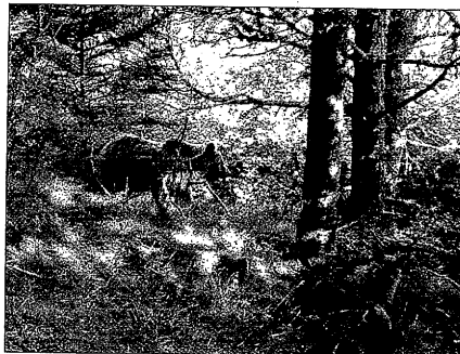
Una osa y sus dos cachorros, en Alt Àneu el pasado julio

Acciónatura, que cuenta con la aceptación local y el apoyo de las EMD de Isil y Alós y del Ayuntamiento de Alt Àneu para su proyecto, es una ONG catalana dedicada a la recuperación de espacios naturales y a la conservación de la biodiversidad que ahora trabaja, entre otros proyectos, en la recuperación