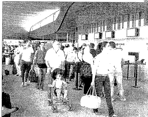
La terminal de l'aeroport, en una imatge d'arxiu.

Llana va dir que Puig, amb les seues declaracions, ha revelat l'actitud de CiU cap a la infraestructura