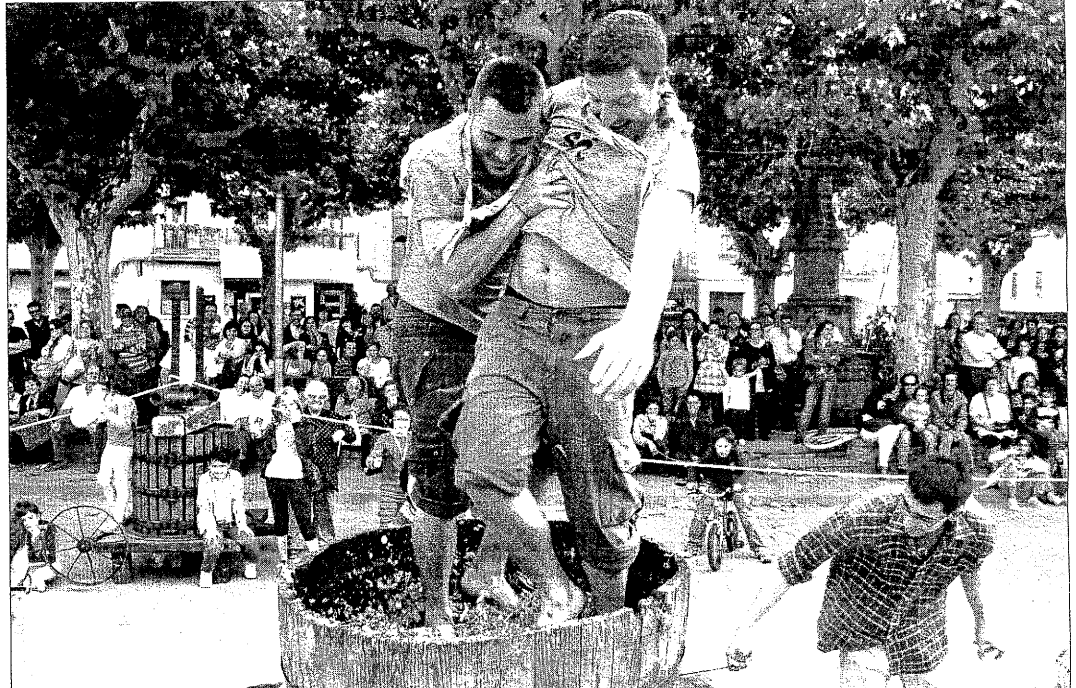
Una de les proves de la marató consisteix a piar el raïm durant 30 segons per parelles per aconseguir el màxim de most.

VERDÚ | Els participants de la Festa de la Verema i del Vi de Verdú hauran trepitjat entre ahir i avui 2.500 quilos de raïm cedit pels agricultors de la població. Ahir al matí va començar el trasllat del raïm fins a la plaça Major, on es concentra l'activitat lúdica de la celebració. El moment fort de la jornada va arribar a la tarda, amb la marató del raïm. Consisteix en quatre proves esportives per parelles. Els participants tenen 30 segons per piar i guanya qui aconsegueix més most. La segona prova, l'aixecament de porró, consisteix a donar i rebre vi d'un porró amb els ulls embenats. També hi ha el llançament de ceps, que consisteix a tirar un cep i encistellar en un barril de vi. La marató culmina amb una cursa per la plaça en què es carrega una portadora de raïm. Aquest any, la marató l'ha organitzat l'associació Escolta Marinada i, segons la seua pre-