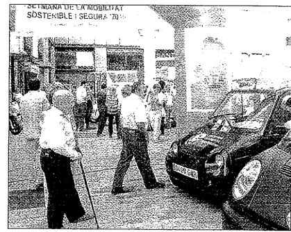
La muestra reunió a unos 30 vehículos en Lleida

"Que Montilla no me hable de reequilibrio territorial porque el desequilibrio lo ha causado el Tripartit. Ahora el 70% de las inversiones se concentran en el Baix Llobregat y en el Barcelonés en detrimento de Ponent y del Pirineu", remarcó Puig.