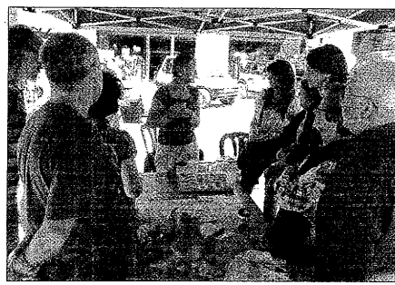
El mercado organiza actividades y talleres paralelos

El Mercat de l'Hort a Taula surgió a finales del pasado año 2009, cuando se concibió en un primer momento para realizarse de forma esporádica. No obstante, tras la buena aceptación de la población leridana la concejala de Mercats i Consum decidió llevar a cabo el mercado de forma mensual parta dar entrada a más productores que habían mostrado su interés por la iniciativa.