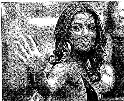
La actriz presentará la gala de esta cadena de televisión

El grupo Kings of Leon y los músicos Ke$ha y Kid Rock se unen a las actuaciones ya confirmadas de Katy Perry y