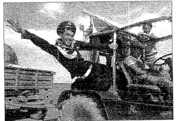
Sergei Dvortsevov, 2008, Kazakhstan, Rússia, Polònia, Alemanya i Suïssa, 100 min. VOSE

La difícil trobada d'una esposa per part d'un noi que torna a casa després del servei militar. Viu a l'estepa de Kazakhstan i allà només es pot ser pastor d'ovelles. El vol tenir el seu ramat propi però s'ha de casar. Hi ha molt poques noies, i l'única que li agrada, "Tulpan", només pensa en marxar a la gran ciutat per estudiar i fer un canvi en la vida.