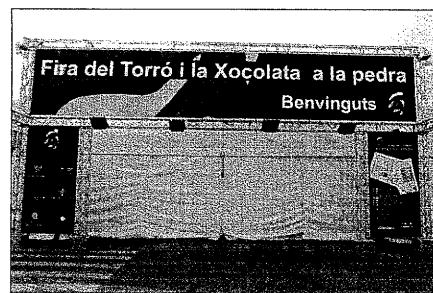
La nueva entrada al recinto ferial del Torrò