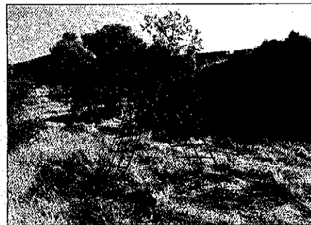
Un juego infantil oxidado a la altura del Baluard del Rei

cordar, tal y como publicó LA MAÑANA la pasada semana, ha sido fuente de críticas por parte de las entidades culturales de la ciudad.