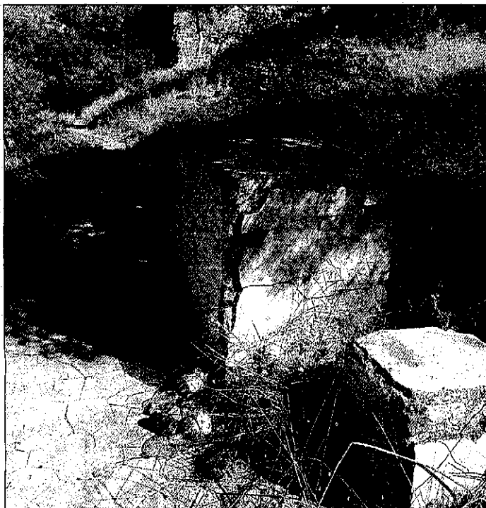
Botellas y una lata tiradas ayer en el suelo junto a unos bloques de piedra

En el Turó de la Seu Vella también hay espacio para la droga. Algunos deciden no subir muy arriba de la colina. De hecho, se quedan al otro