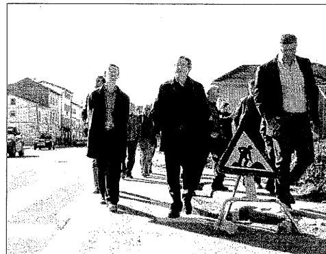
El conseller Ausàs, al centre, en la seua visita a Vilaller.