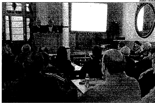
Presentació de la xarxa de Pobles amb Encant de Salàs de Pallars.

Després de l'assemblea, Salàs va acollir una presentació pública de la xarxa de Pobles amb Encant, un acte que va comptar amb la participació del