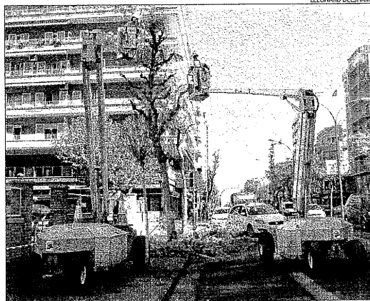
Dos operaris poden un arbre a Prat de la Riba.

Decathlon compta amb 78 centres repartits per Espanya (va obrir el primer el 1992), sis magatzems logístics (cinc de regionals i un de continental) i més de 10.500 col·laboradors.