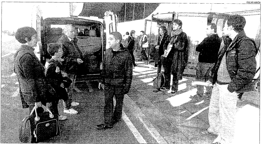
Els passatgers del vol Lleida-Barcelona col·locant els seus equipatges al taxi que els va traslladar fins a Barcelona.

a "reestructuracions horàries", fet que va obligar a posposar l'estrena oficial al cap de setmana passat. La ruta va arrencar amb tot just 50 passatgers i l'anunci de Vueling de rebaixar el preu del bitllet de 19 a 9 euros per donar sortida a aquest peculiar pont aeri.