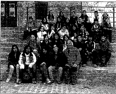
IES PONT DE SUERT

Montanuy les cedió el local de albergue de Castanesa