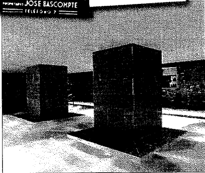
El 'spa' del hotel y, arriba, publicidad de los años 30