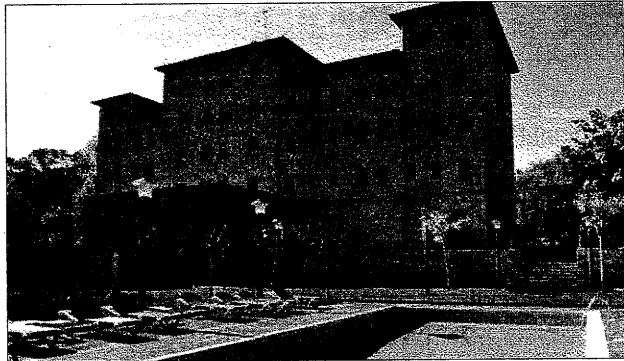
El complejo consta de un edificio de piedra de cinco plantas, jardín y piscina

Un edificio de 3.000 metros y cinco plantas con 'Spa'