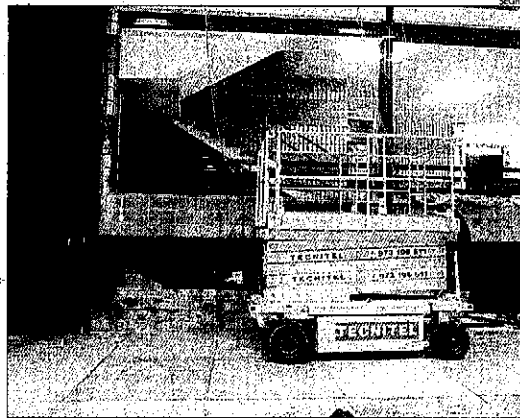
L'accident mortal va passar al pavelló municipal.

A més, al mateix comunicat també va anunciar la seua in-