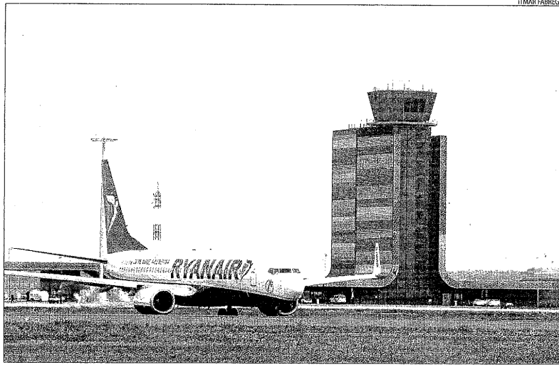
Un avió de la companyia irlandesa, maniobrant el mes passat a l'aeroport.

Precisament, a l'abril es complirà el primer any dels vols de la companyia irlandesa des d'Alguaire. Durant aquests dotze mesos, Ryanair ha quedat exempta de pagar les taxes aeroportuàries.