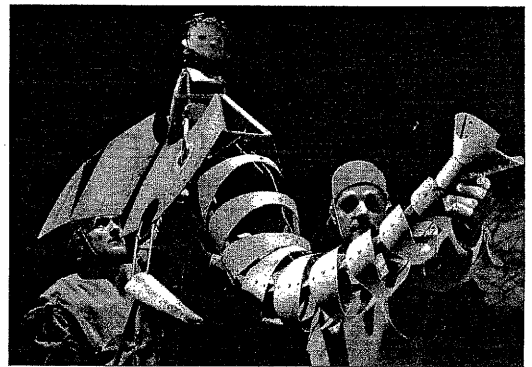
'Mowgli, l'infant de la jungla' se representará en breve en Francia