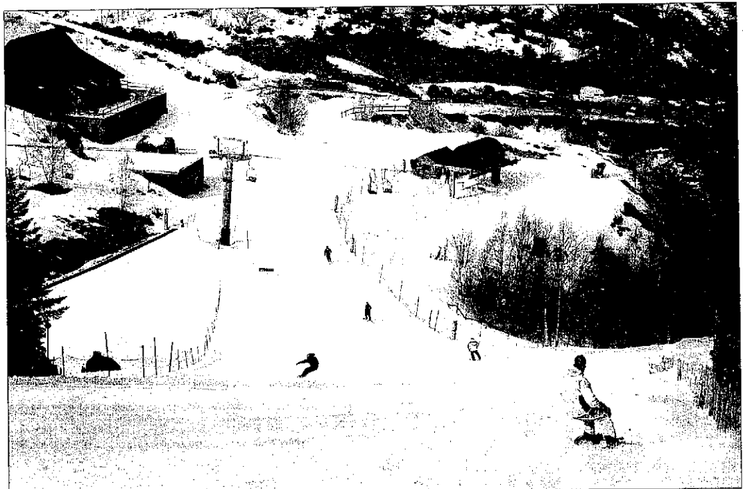
Les pistes de Tavascan, al Pallars Sobirà, tenen entre 150 i 180 centímetres de neu després de l'últim temporal.

■ Malgrat que alguns complexos no van poder obrir per la Puríssima, les contínues nevades, en especial la de dilluns, han fet que les perspectives siguin bones i s'espera tindre una temporada bona, similar a la de l'any passat.