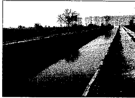
ORIOL BOSCH ACN

Las abundantes lluvias y nevadas de este invierno han obligado a la Comunitat de Regants dels Canals d'Urgell