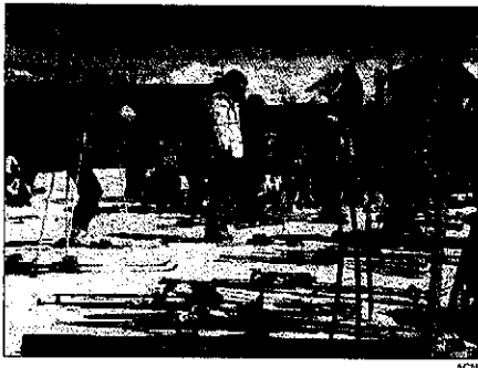
La última nevada ha dejado las pistas en óptimo estado