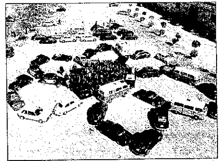
Los vehículos realizaron divertidos dibujos