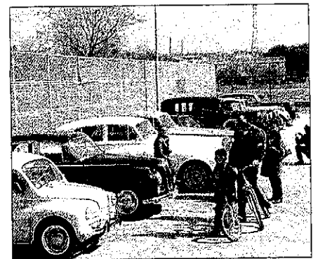
Concentración de coches antiguos en Lleida

Desde el sábado, más de sesenta Volkswagen clásicos —escarabajos, la mítica furgoneta Bully y también algún Golf de primera generación— circularon por las calles de la capital del Bajo Cinca gracias al Ayuntamiento de la ciudad y al Volkswagen Club Zaragoza, las dos entidades organizadoras de la cita.