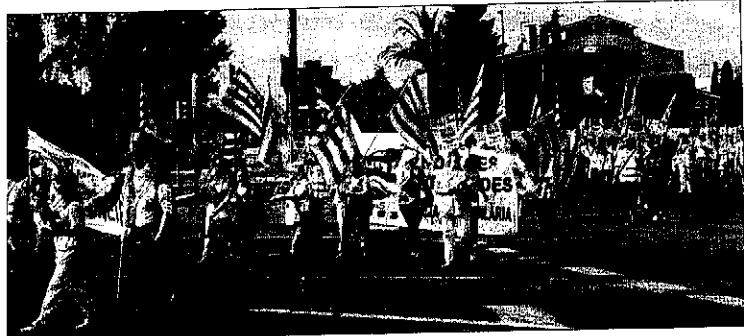
Manifestació va tallar durant uns minuts la carretera d'Osca.