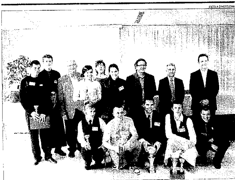
Concurs de còctels a l'Escola d'Hoteleria ■ Nou escoles d'hoteleria de Catalunya, València i Aragó van participar ahir en el dinovè concurs de cocteleria Trofeu Ciutat de Lleida. El primer premi del concurs va ser per als alumnes de l'Escola d'Hoteleria de Lleida, que van preparar un còctel sota el títol FC Barcelona, preparat amb Blue Tropic, sucre i suc de llimona, entre altres ingredients. El segon premi va ser per als alumnes de Castelldefels.

Per la seua part, l'Institut Nacional d'Estadística va fer ahir públic dades sobre els noms i cognoms més utilitzats. A la província de Lleida, des de l'any 2000 guanyen els David, Alex i Roger i les Maria, Júlia i Paula. Contrasten amb els Antonio, Francisco, Juan, Maria, Teresa i Rosa, els més posats abans del 1930.