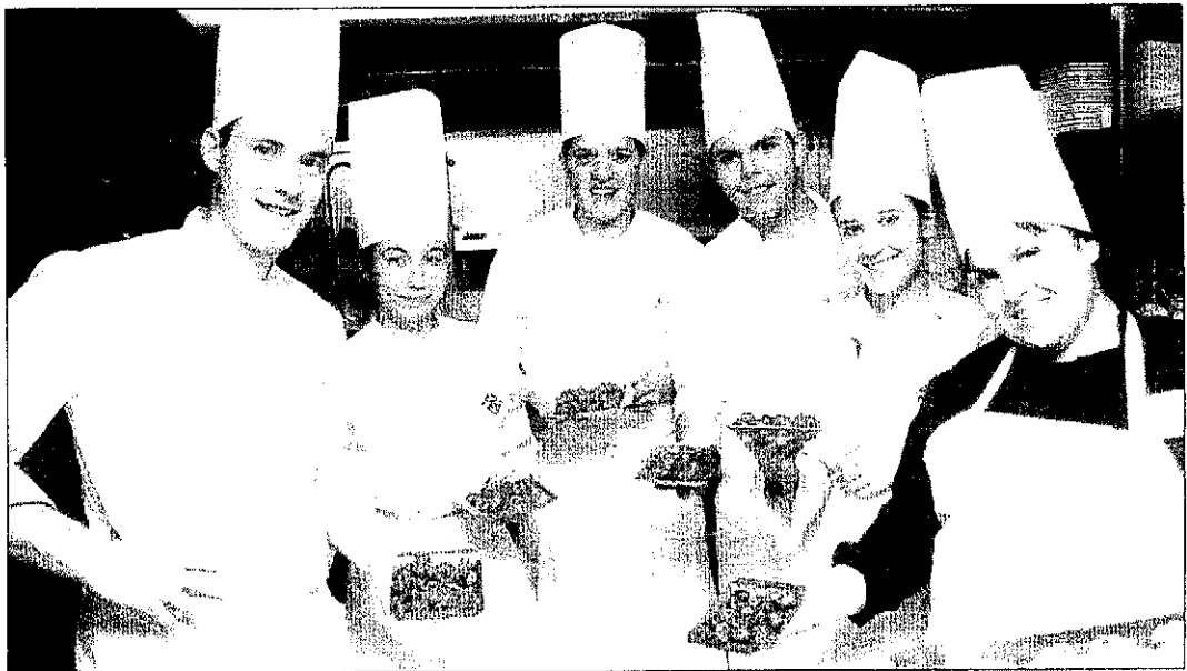
El Caragol Tour gaudeix de la col·laboració de l'Escola d'Hoteleria i Turisme de Lleida des dels inicis.

A més, les firmes comercials: San Miguel, la Caixa d'Estalvis i Pensions de Barcelona "la Caixa", el cava Rabellat i Vidal, Ioli Terrall de la Cooperativa de Sant Isidre de les Borges Blanques, Cafès Tarrazú, AC Hotels, Cal Jep, Grup Segre, la Bruixa d'Or i Renfe, donen el seu suport a una promoció que després de L'Aplec visitarà Encamp-Andorra (16 de setembre) i Burgos (24 d'octubre).