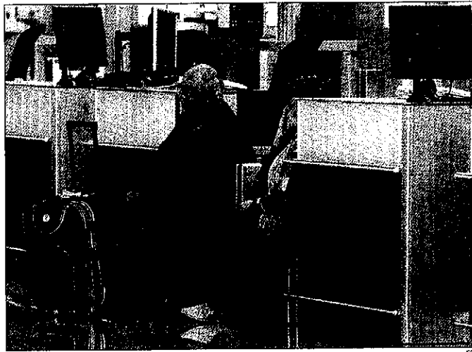
Dos pasajeros, sentados en una cinta del aeropuerto de El Prat, en Barcelona

Si se cumplen las previsiones de Blanco, el aeropuerto de Alguaire podría operar con normalidad. Si hay un retraso en la apertura del esp-