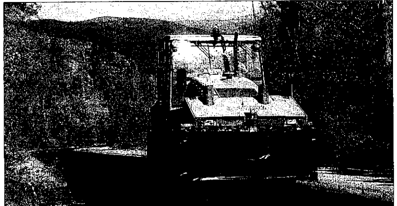
Les obres d'adequació de l'accés a l'aeròdrom.

Paral·lelament, el departament de Política Territorial continua redactant el pla director urbanístic de la infraestructura, que n'ha de determinar els futurs usos i valorar si és possible convertir-la en aeroport.