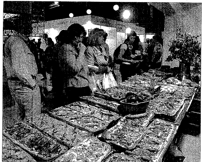
AJUNTAMENT DE TÀRREGA

Així, l'Agrupació d'Amics de Tàrrrega-Blaye obrirà durant el dissabte a la tarda un estand amb especialitats de la