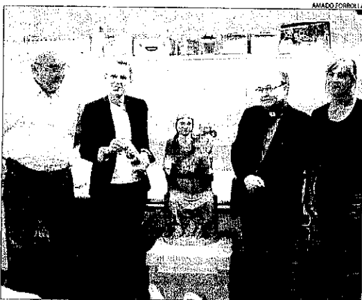
La marededéu de Santa Maria de Gardeny, ahir al Museu de Lleida.