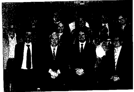
La 'conselleria' de Cultura acogió ayer la presentación del festival

Además, recupera el Libro segundo de tonos y villancicos a una, dos, tres y cuatro voces , obra del que fue