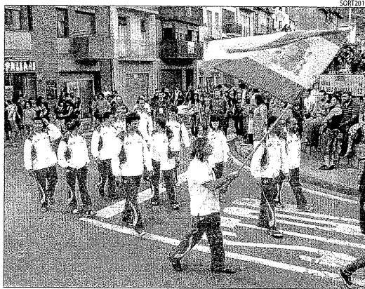
La selecció espanyola, durant la desfílada de països participants.