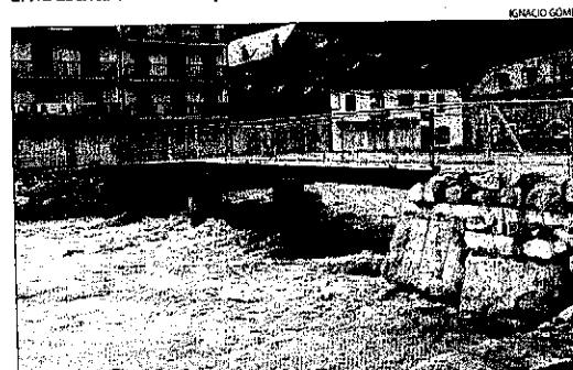
LA PASSAREL·LA PROVISIONAL DE BOSSÒST VA QUEDAR TANCADA AL TRÀNSIT.

s'esperava a Balaguer una punta màxima de 265 metres cúbics per segon. Paral·lelament, Endesa preveia iniciar el desembassament de Talarn, deixant anar uns 250 metres cúbics per segon, que parcialment recolliria el pantà de Camarasa, al 80% de la seua capacitat i situat aigües avall a la Noguera Pallaresa, just abans de la confluència amb el Segre. La intenció de la CHE era regular l'avingu-