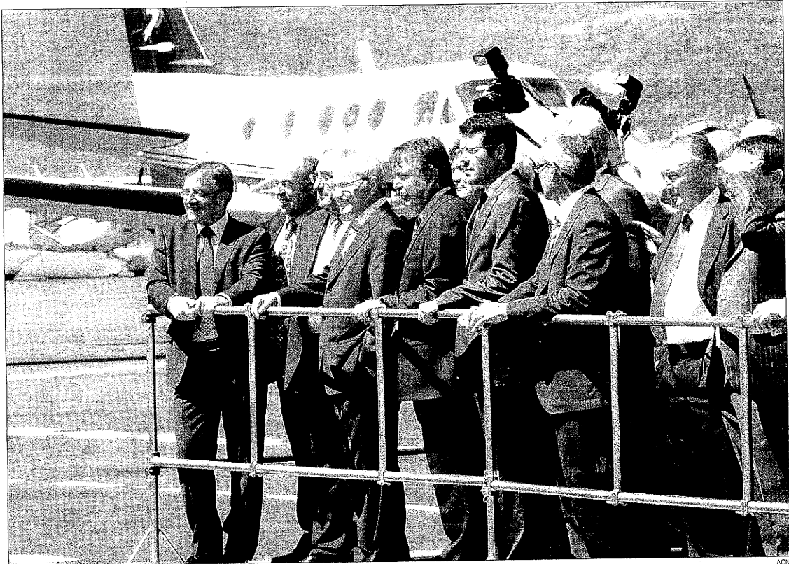
Montilla inauguró las recién remodeladas instalaciones del Aeropuerto de la Seu d'Urgell acompañado de todas las autoridades locales

El conseller de Política Territorial, Joaquim Nadal, fue el encargado de dar los de-