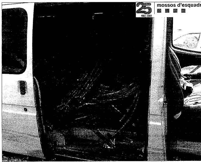
Imagen de otra incautación de cable realizada por los Mossos en Castellnou de Seana