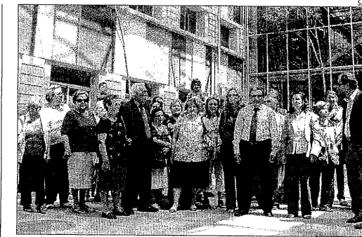
Un grup de visitants durant la jornada de portes obertes.