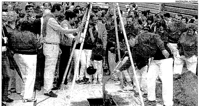
Els Castellans de Lleida també van ajudar a col·locar la primera pedra.

Aquestes obres formen part del pla de barris del Centre Històric i tenen un pressupost d'1,5 milions.