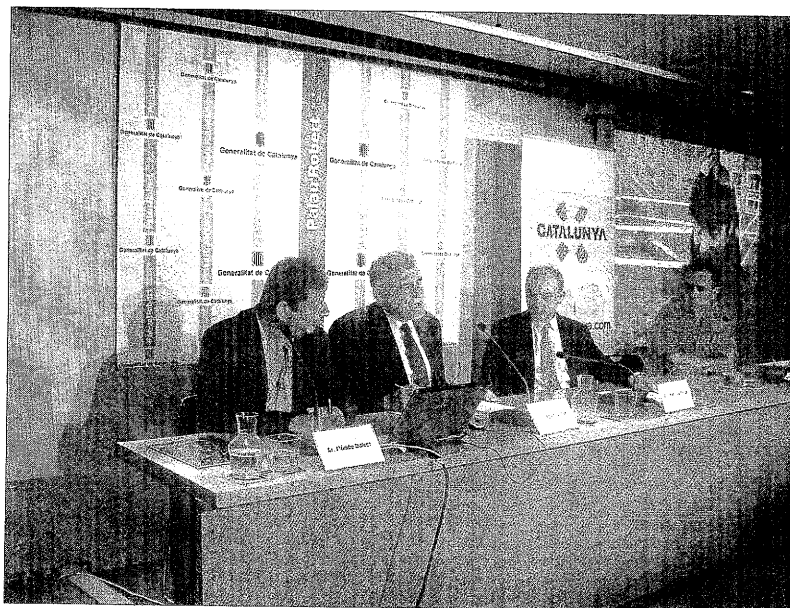
Un moment de la presentació del Mundial ahir al Palau Robert de Barcelona.