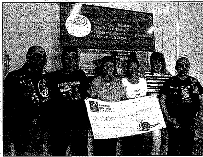
Los moteros recaudaron el dinero en la Matinal Motera