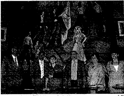
Angel Lendínez presentó su ponencia en la Diputación