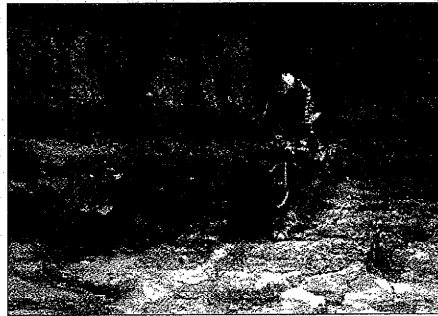
Un miembro de la organización, en una de las zonas