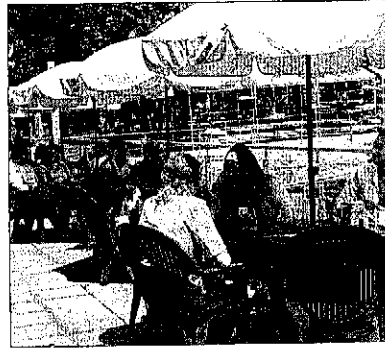
La Seu d'Urgell. Turistes al parc olímpic.

da pels turistes són les esglésies romàniques de la vall de Boí, patrimoni de la humanitat, que van rebre al llarg de l'any passat 120.227 turistes. Al juny del 2010 hi va haver 9.746 visitants i durant el mateix mes d'aquest any s'han elevat a 12.341 (un 26 per cent més). Aquest juliol ja han passat per les esglésies romàniques 7.610 persones (unes 500 al dia).