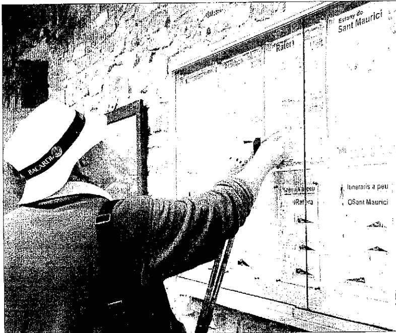
Entrada al parc per Espòt. Una parella de turistes observen les indicacions per recórrer Aigüestortes.