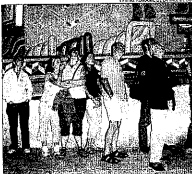
Romànic. Turistes visitant Sant Joan de Boí.