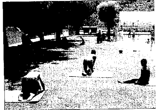
La Fundación ONCE organiza estas actividades cada año