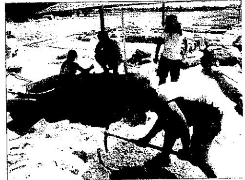
Los alumnos de curso excavan desde el pasado lunes

Esperan que el yacimiento sea visitable a partir del próximo mes de setiembre