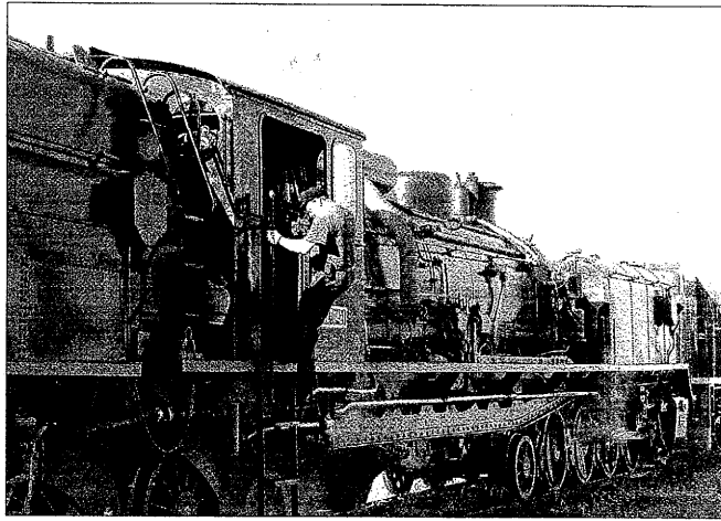
El Tren dels Llacs utiliza la Garrafera como tren histórico desde Lleida a Balaguer

El tren histórico circula los sábados y el tren de línea turística lo hace los domingos y, como novedad de este año, también circulará los fines de semana de julio y agosto. El