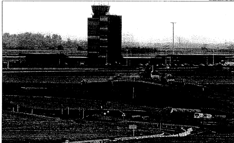
Imatge recent de l'aeroport d'Alguaire i de les obres del pont sobre la futura autopista.

Segons la normativa de l'Aerocat, els plans hauran d'incloure la designació d'una persona encarregada de coordinar els mitjans humans i materials per fer front a possibles emergències, així com determinar elements "vulnerables" com nuclis de població, equipaments, carreteres i línies ferroviàries, entre altres, i establir prioritats d'actuació. També haurà de preveure les necessitats d'atenció i allotjament de víctimes i els seus familiars en cas d'accident.