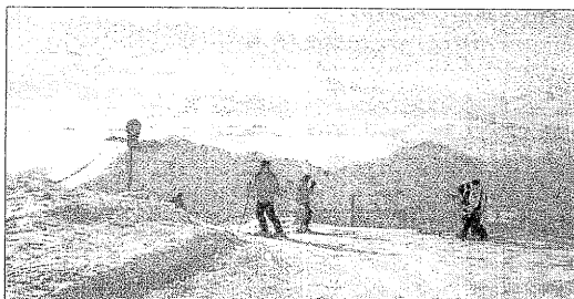
Fotografia dels últims dies amb esquiadors a Boi Taüll.

va assenyalar que l'ocupació durant la campanya nadalenca ha sigut "més que satisfactòria" i va assenyalar que la distribució dels dies festius en relació amb els caps de setmana, sumat al bon estat de les pistes, ha contribuït decisivament a superar les expectatives del sector turístic.