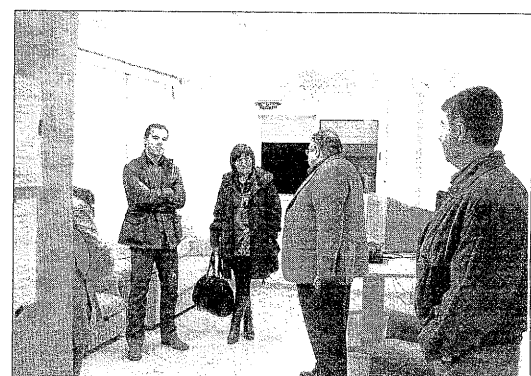
Nou local per a joves a Maldà ■ Maldà ha inaugurat el nou local per a joves, en un immoble de titularitat municipal al carrer Castell Ait.