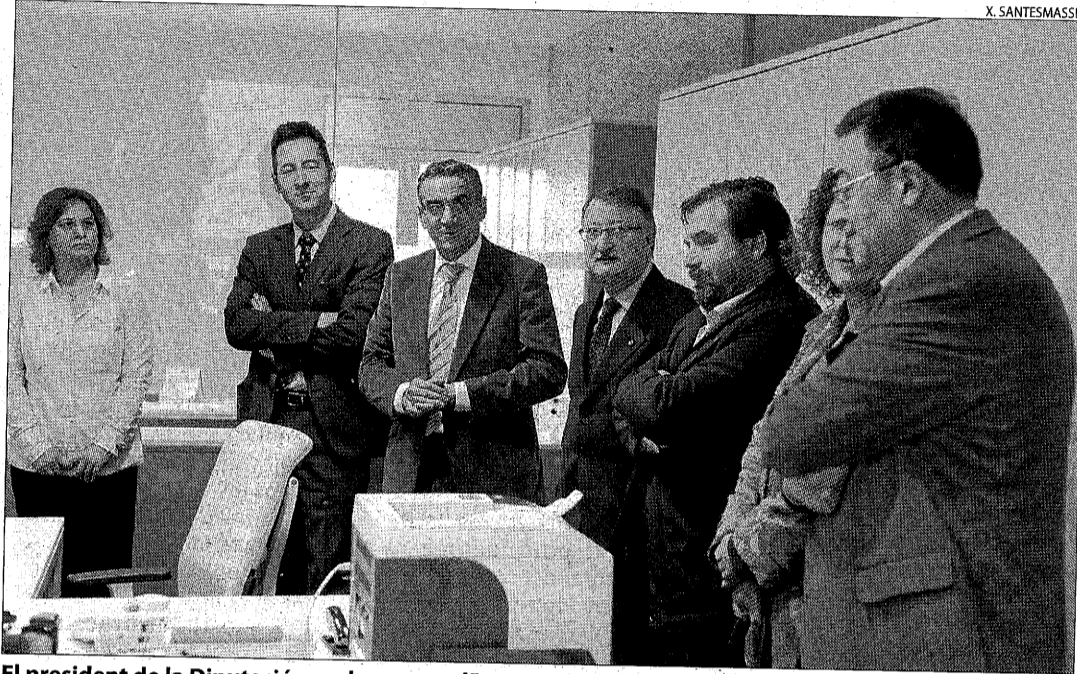
El president de la Diputació, en el moment d'inaugurar l'oficina de Recaptació a Cervera.

Sant Guim de Freixenet està ultimant la posada en funcionament del seu centre de dia que, segons l'alcalde, Pere Solé, entrarà en funcionament el pròxim mes de març. El projecte va ser presentat ahir als alcaldes de vuit municipis de la Segarra i l'Anoia (Estaràs, Ribera d'Ondara, Talavera, Montmaneu, Veciana, Pujalt, Igualada i Cervera) als quals s'ha ofert la possibilitat d'acudir a les instal·lacions. El centre tindrà 27 places i la gestió anirà a càrrec del Consorci Sanitari d'Igualada i la coordinació, a càrrec dels serveis socials del consell de la Segarra. Segons Solé, el Consorci tindrà la gestió inicialment per 5 anys i aportarà uns 70.000 euros amb què es finançarà el mobiliari del centre de dia. També s'està estudiant una línia de transport per recollir els usuaris de les poblacions que vagin al centre. A la reunió hi va ser present el president de la Diputació, Jaume Gilabert, que va elogiar la iniciativa de l'ajuntament d'obrir el complex a municipis veïns. El centre de dia ha costat 1,2 milions