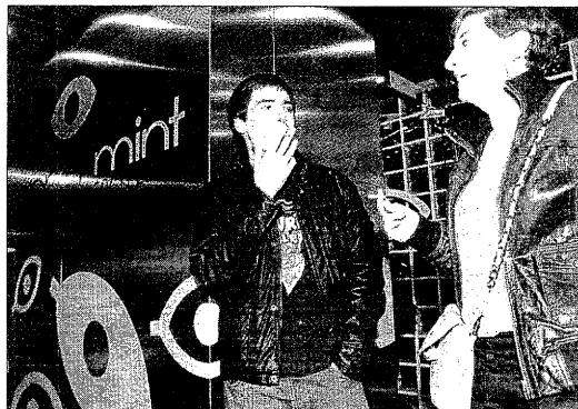
Malgrat el fred, els fumadors van sortir al carrer.