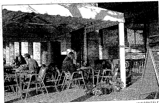
Una terraza de Lleida el día después de la entrada en vigor de la ley

Todas estas quejas, sugerencias o problemáticas serán remitidas al Departament de Salut al Ministerio de Sanidad, a fin de que den respuesta a las mismas y que se hagan responsables de sus consecuencias.