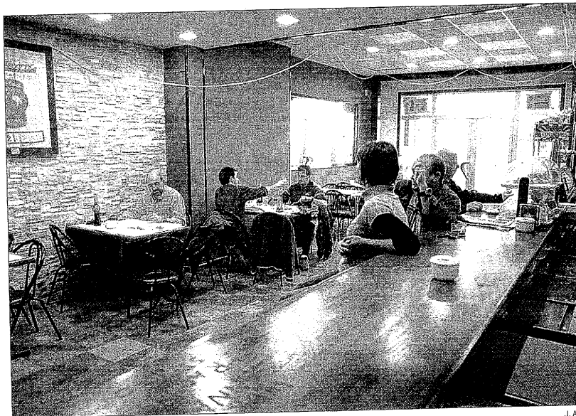
El bar recibió la visita de un inspector de Salud a las pocas horas de indicar en un cartel que dejaba fumar

La Mossadeta se inauguró hace escasamente tres meses y solía ser un establecimiento con una importante afluencia de público, ya que