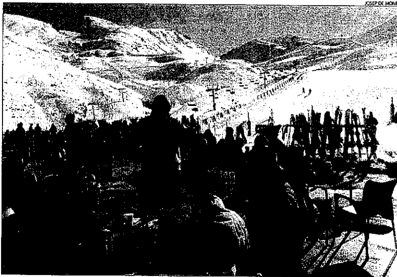
Dia assolat a Boí Taüll, ideal tant per baixar per les pistes com per prendre alguna cosa en una terrassa.

Malgrat que el mal temps ha fet més mal que la crisi, Serrano va dir que "la despesa mitjana per persona també ha baixat". Un portaveu de Boí Taüll Resort va situar el descens del consum, sobretot en restauració, entre el 4 i 5%. Tot i que ahir va finalitzar la campanya de Nadal, algunes persones, en especial procedents de la comunitat de Madrid, allargaran les vacances fins diumenge. Això implica que l'ocupació es mantindrà entre 85 i el 100% als hotels de Gran Pallars i Boí Taüll.