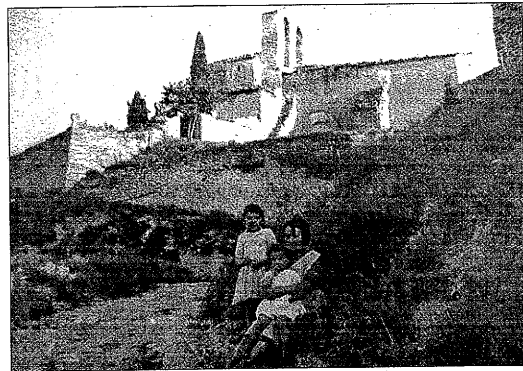
Una de las fotos que se gan recibido hasta ahora