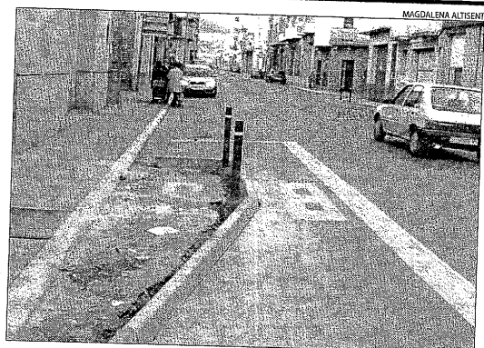
Espai per als fanals ■ Els fanals s'instal·laran als illots construïts a la calçada, que passa d'onze a set metres. Pujol assegura que els problemes d'evacuació d'aigua ja estan resolts.

Respecte a l'evacuació de l'aigua de pluja, va afirmar que s'havien modificat els illots per evitar aquest problema.