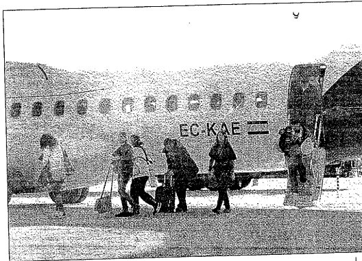
Hace 15 días llegaban los primeros esquiadores con Pyrenair

● La ruta cerrada estaba por debajo del 15% de la ocupación prevista