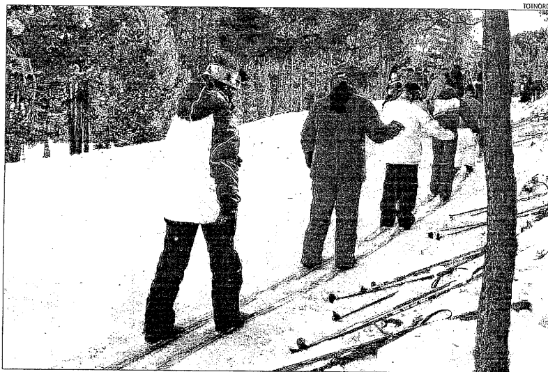
Nens practicant l'esquí de fons aquesta setmana a l'estació de Tuixent-la Vansa.

Batalla va remarcar que la innivació artificial és un projecte en què s'ha d'incidir ja que aquestes estacions, a més d'ofereir la pràctica d'un esport complet, també són un nexu molt més directe amb la natura i un motor econòmic i turístic per als petits pobles en què s'ubiquen, com és el cas de Castellbò o Josa i Tuixent, la Vansa i Fornols, a l'Alt Urgell; Lles o Aransa, a la Cerdanya; o Tavascan o el Bosc de Virós, al Sobirà. En el cas de Bosc de Birós, Batalla va indicar que és un complex al qual fins fa poc s'havia accedir en jeep. "Són problemes que anem solucionant a poc a poc i, ara, hem d'aconseguir una continuïtat en l'activitat hivernal", va remarcar.