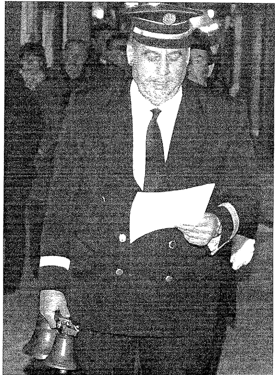
AJUNTAMENT DE SOLSONA

Sin embargo, el pregonero no sólo anuncia las defunciones, también lee los pregones de fiestas. En el caso de la Festa Major, Isanta cambia las campanas por un trompeta para que los ciudadanos distingan su aviso.